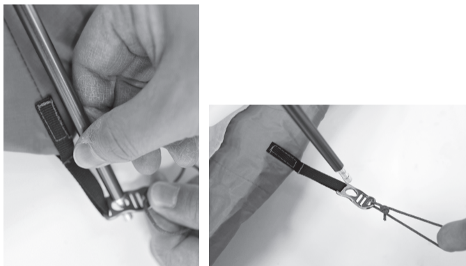
①部分2か所にメインポールを ②部分にポールを差し込みます。 差し込みます。