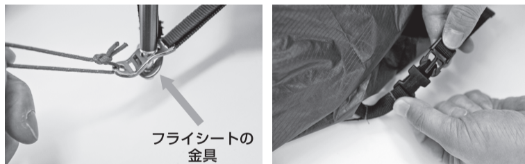
組み立て済みの本体メインフレームの ③部分2か所のジョイントを止めます。 下からフライシートの金具を入れます。